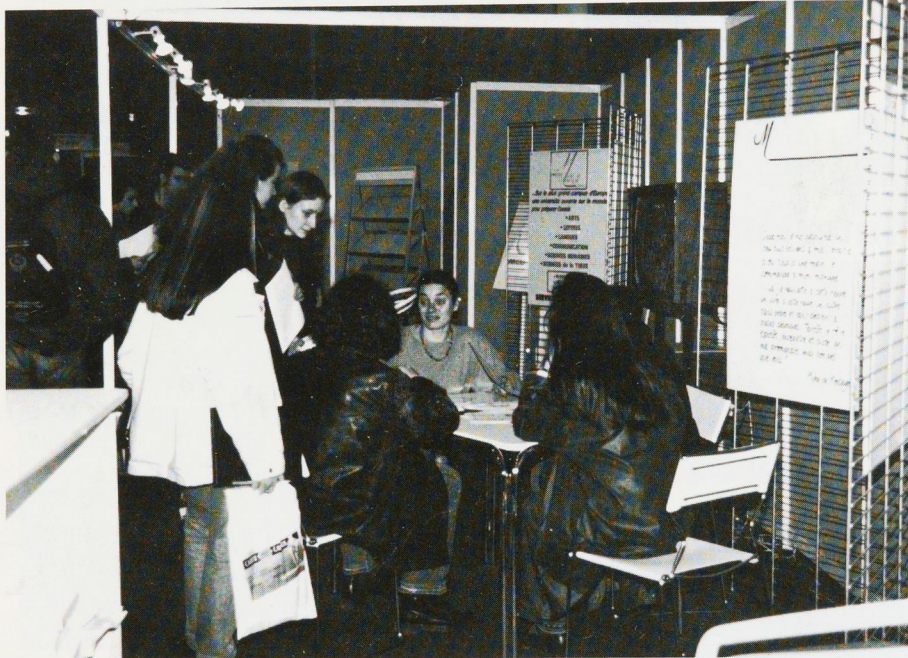
Une présence utile