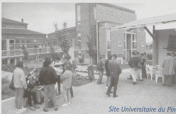
Site Universitaire du Pin