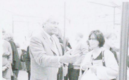
Le Président de l'Université au stand des PUB

Cette édition a également vu plusieurs de nos enseignants participer aux conférences programmées.