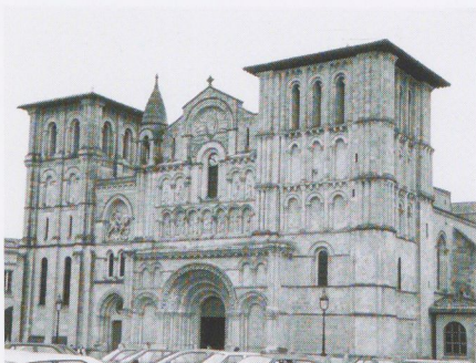
L'église Sainte-Croix abrite l'orgue "Dom bedos".

Les 27 et 28 mai, cet événement musical se poursuivra par un colloque international sur la figure de Dom Bedos de Celles, mémorialiste universel de la facture d'orgue, et l'avenir de l'orgue au XXIème. Un article dans le prochain numéro de Contact sera consacré à cette manifestation unique organisée par l'Université, le Service Culturel, l'équipe de recherche ARTES, l'UFR SICA, et l'association « Renaissance de l'Orgue à Bordeaux ».