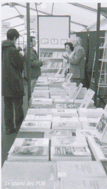
Le stand des PUB