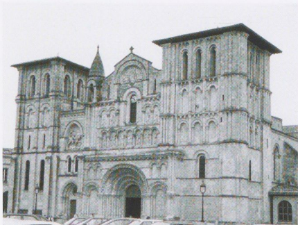
L'église Sainte-Croix abrite l'orgue "Dom bedos".

Les 27 et 28 mai, cet événement musical se poursuivra par un colloque international sur la figure de Dom Bedos de Celles, mémorialiste universel de la facture d'orgue, et l'avenir de l'orgue au XXIème. Un article dans le prochain numéro de Contact sera consacré à cette manifestation unique organisée par l'Université, le Service Culturel, l'équipe de recherche ARTES, l'UFR SICA, et l'association « Renaissance de l'Orgue à Bordeaux ».