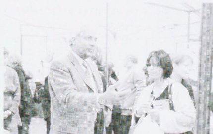
Le Président de l'Université au stand des PUB

Cette édition a également vu plusieurs de nos enseignants participer aux conférences programmées.