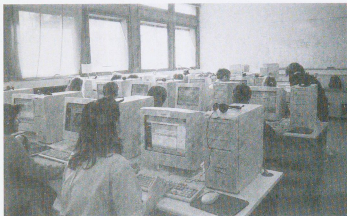
Session de formation organisée par la cellule Formation Continue des Personnels

responsable de la formation continue des personnels