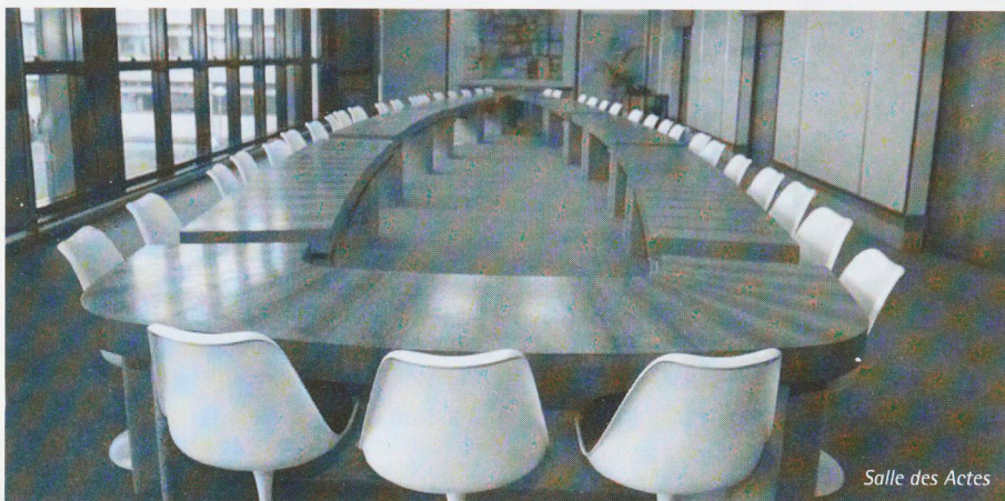
Salle des Actes

Trois semaines avant le début des élections des représentants étudiants, une campagne d'information, de communication et d'incitation au vote, par voie d'affichage sera déployée dans l'Université, à l'antenne d'Agen et à l'IUT Michel de Montaigne.