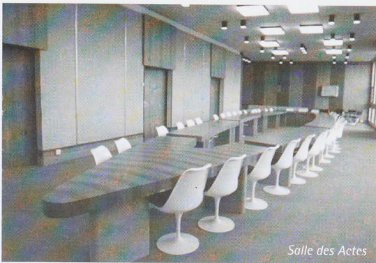
Salle des Actes

Il assure la liaison entre l'enseignement et la recherche, notamment au niveau du 3 ème cycle.